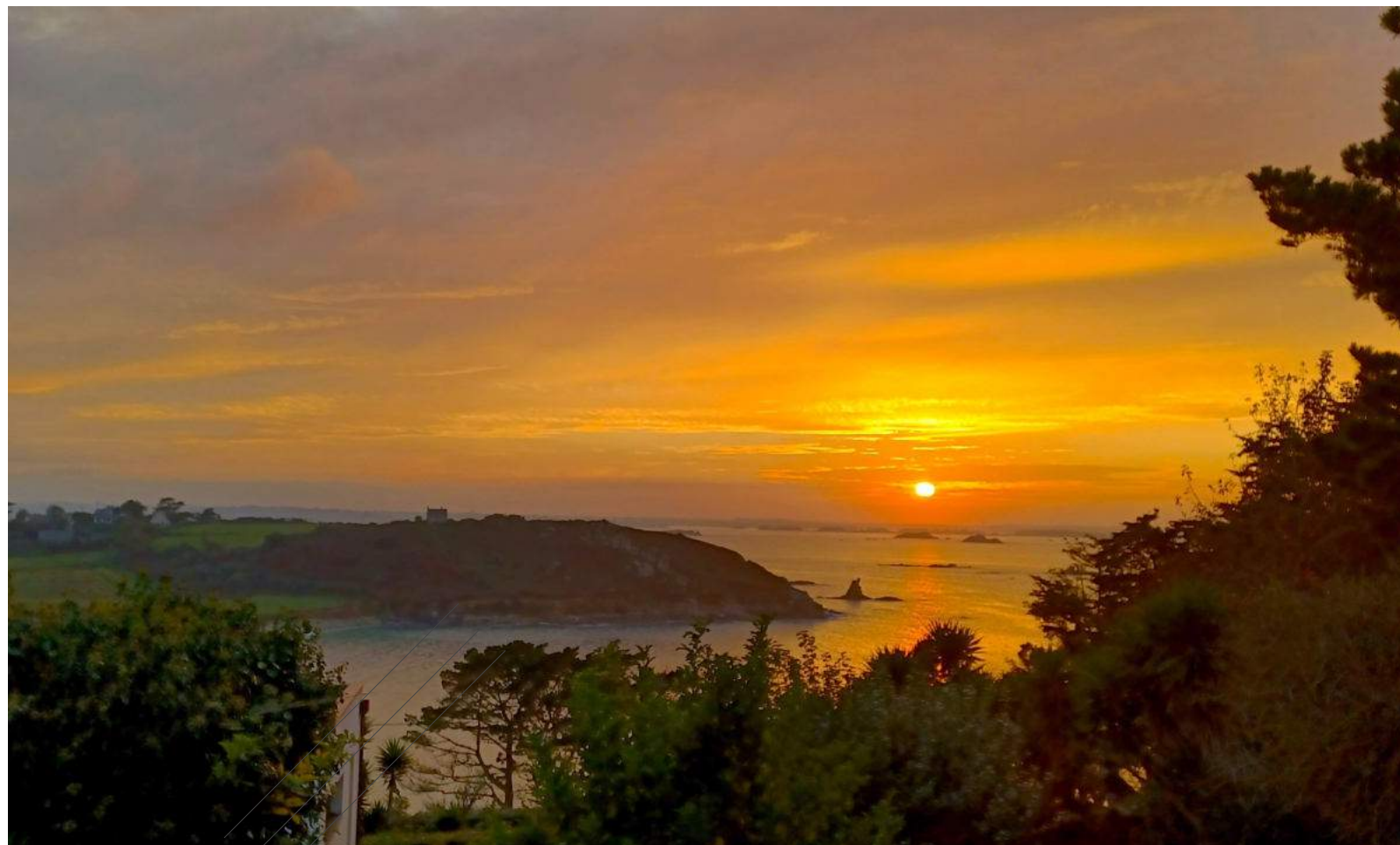
Baie de Morlaix, plages du Guerzit et Bonaparte

Réservation jusqu'au 20 mai : versement d'arrhes de 30%